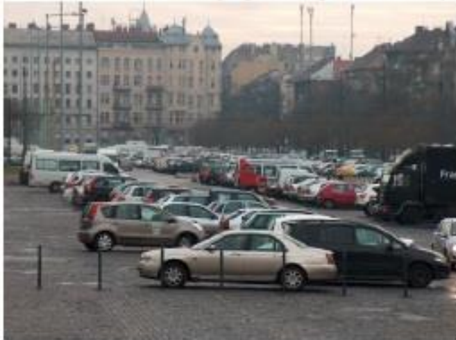
Parkoló foglaltság munkanap